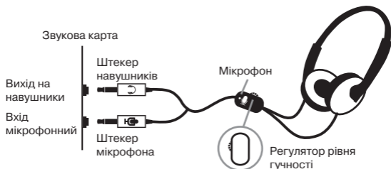
Мал. 1. Схема підключення